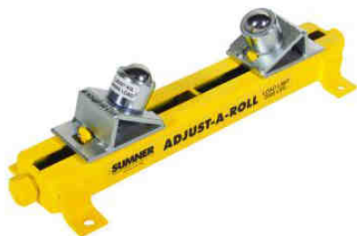
Table Adjust A Roll